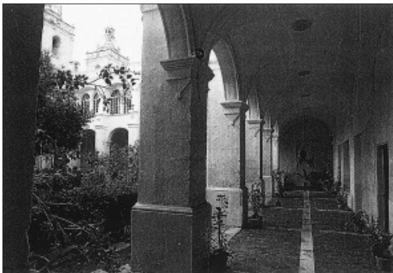
Claustro de antiguo convento agustiniano del Socorro, con su iglesia al fondo Ciudadela-Menorca

“Como se conoce que no han llegado [ahí] los trabajos de la guerra ¿qué dirían V. V. P. P. si se les pidiera toda la renta del año y aún los atrasos anteriores a la invasión de los vándalos, como se nos piden a todos los regulares que hemos sufrido el yugo francés? Es preciso que nos hagamos cargo que el más necesitado de la nación es el monarca, a quien los malvados que nos querían dominar intentaron sitiar por el hambre. Esta consideración debe hacernos tolerables todas las providencias, que aunque parezcan duras, son involuntarias” 3 .