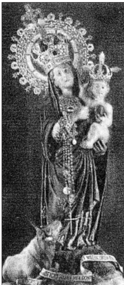
Nuestra Señora de Monte-Toro. Patrona de Menorca Antiguo Santuario-convento agustiniano (hasta 1835)

“Tiene la santa imagen tres palmos de alto, es algo morena, pero muy hermosa, su rostro alegre y risueño, y su manto es de color azul; en la mano izquierda tiene a su niño Jesús, y la derecha tiene arrimada al pecho, como quien la da a besar; es muy milagrosa, y especialmente con los navegantes, que la imploran en sus peligros y tormentas, y socorridos la ofrecen muchos votos y preseas que adornan el altar y su capilla” 8 .