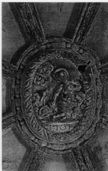
Vista general de l'església i convent del Socors. Clau de la cúpula del transaltar.